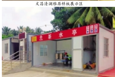
文昌清澜雅居茶水亭