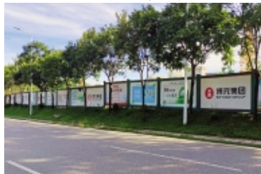
三亚时分亚龙湾施工现场围挡