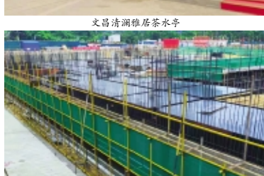
三亚澜山金曲商业地块脚手架搭设规范