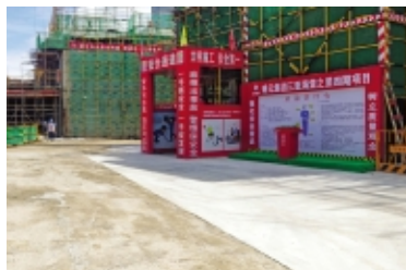
三亚海棠之星安全通道和班前讲评台