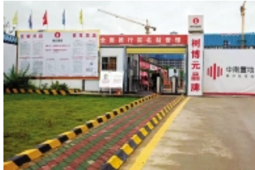
文昌清澜雅居样板展示区