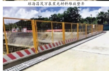
三亚时分亚龙湾基坑排水沟和临边围护