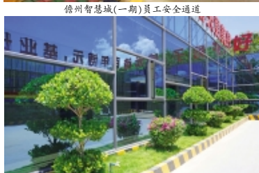
儋州智慧城(一期)员工安全通道