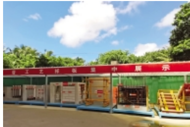
琼海昌茂万象星光材料堆放整齐