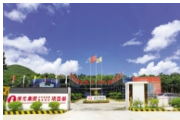
三亚时分亚龙湾项目部

编者按:“做好今天的现场,赢得明天的市场”。在项目施工过程中,博元集团海南分公司严格按照公司《安全文明施工标准化手册》、《海南省建筑施工安全标准化管理规定》要求组织施工,并从办公区、生活区设施以及扬尘治理、噪音控制等方面入手,用高标准的质量形象、安全形象、文明形象,树立了博元集团鲜明的企业形象。海南分公司自2020年10月搬迁至海口以来,进一步加大对海口、文昌、三亚、儋州、博望等地区的市场开拓力度,先后承建了儋州中南智慧城、三亚澜山金曲、文昌光清澜雅居、三亚天誉租赁式住宅、文昌约亭勤富产业园等项目,其中文昌清澜雅居项目获得2021年龙光集团品质安全联合检查第一名的好成绩,海南文昌电视台《文昌新闻》栏目走进文昌清澜雅居项目建设工地进行专题采访报道。正是对品质的不懈追求,博元集团在海南建筑领域赢得了好口碑。