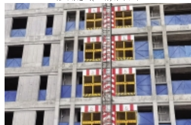
儋州智慧城(一期)施工升降梯防护门和楼层临边防护