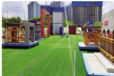
儋州智慧城(一期)样板展示和安全体验区