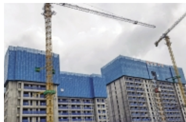
儋州智慧城(一期)自升爬架