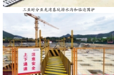
三亚澜山金曲商业地块基坑上人通道