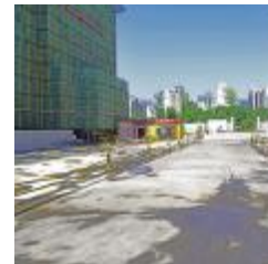
施工现场干净整洁