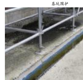
立杆基础及排水沟