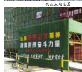
施工升降机防护棚