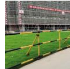
道路临边防护及绿化