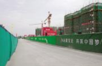
施工道路水泥硬化