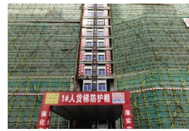
施工升降机卸料平台防护