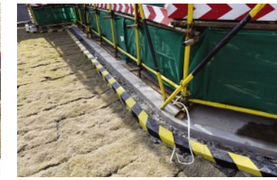
外架防雷接地和排水沟