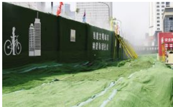
裸土覆盖人造草皮