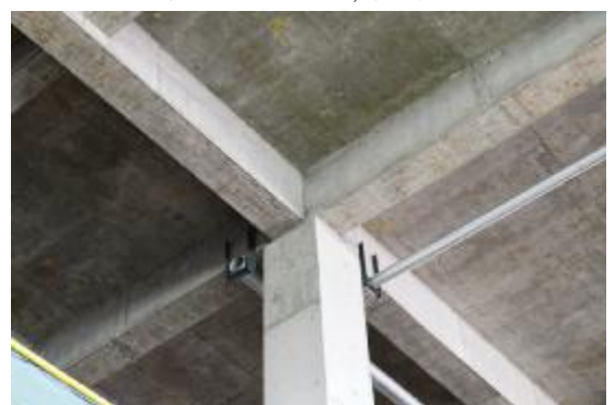
梁柱接头棱角分明,截面准确