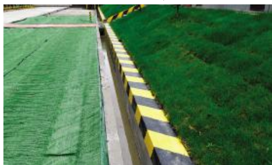
裸土覆盖草坪,设置排水沟