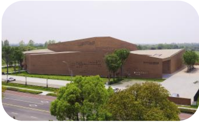
马家浜文化博物馆

南湖区基金小镇一期，亲水花园式办公楼项目由嘉兴市南湖金融区建设开发有限公司投资建设。项目位于南湖新区，北至长水路，南至河道，西至南江路，建筑面积约3万平方米，共规划20幢“按需定制”的单体办公楼，2层钢筋混凝土框架结构，2016年11月25日开工建设，2019年3月12日完成竣工验收。基金小镇项目被评为嘉兴市经济技术开发区标化工地；基金小镇QC小组被评为2018年度全国优秀工程建设优秀质量管理小组。