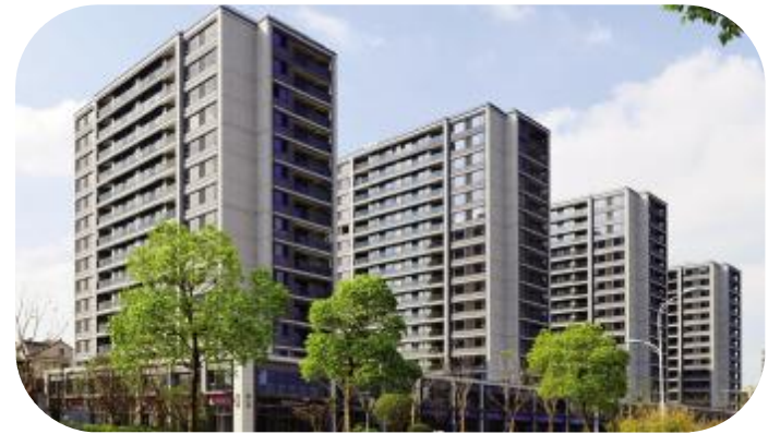
海宁绿城华景川·桂语江南

南江公寓拆迁安置小区二标段工程由嘉兴国际商务区投资建设有限公司投资建设，位于嘉兴市南江路与由拳路交叉口西南侧，总建筑面积约10.1万平方米，2015年11月20日开工建设，2018年4月1日竣工。该项目被评为嘉兴市建筑业绿色施工示范工程、2017年度浙江省“文明现场、和谐工地”竞赛先进工地；南江公寓项目部QC小组被评为2017年浙江省工程建设优秀质量管理小组；项目部还成功举办了嘉兴经济技术开发区(国际商务区)施工现场高空坠落事故应急救援演练暨建设工程安全生产月现场会，获得行业主管部门和业主单位的一致好评。