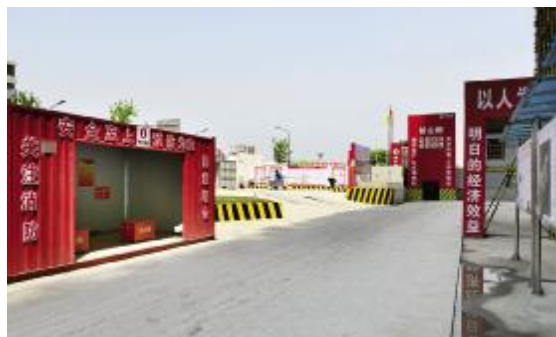
水泥硬化的施工主干道

编者按: 圣托(嘉兴)妇女儿童医院项目,是嘉兴经济技术开发区引进的现代服务业项目,总建筑面积约54624平方米,总投资3亿元。项目目前正处于主体施工阶段,室内安装配套工程同步进行中。 从进场施工以来,项目部严格按照公司《安全文明标准化手册》组织生产,把文明施工渗透到了现场的每个角落。在施工现场,混凝土浇筑的施工主干道宽敞平坦,干净整洁;架体基础干净整洁,回填层裸土绿化到位,围墙和架体四周安装喷淋系统,控尘降温;定型化围挡整齐美观,排水沟设置规范;钢筋加工棚、干混砂浆桶等搭设标准统一,企业特色鲜明…… 3月27日,嘉兴市委书记张兵莅临圣托(嘉兴)妇女儿童医院项目部开展安全生产专题调研,对项目的安全生产和文明施工工作给予肯定。接下来,项目部要在文明施工全覆盖的基础上,进一步加强对工程质量的把控,确保工程创优工作顺利开展。