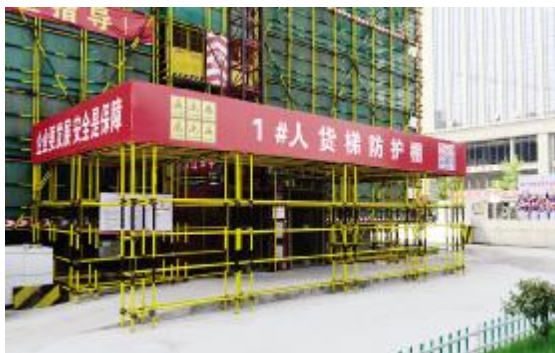
施工升降机防护棚