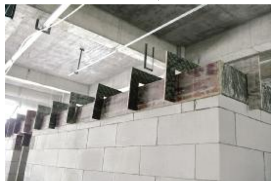
加气砌块顶部混凝土支模