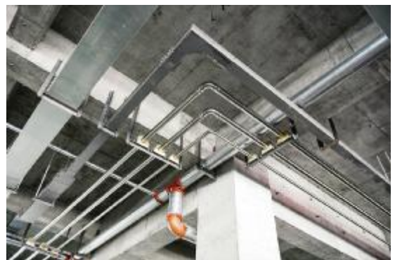
管道转角安装圆顺,桥架平直