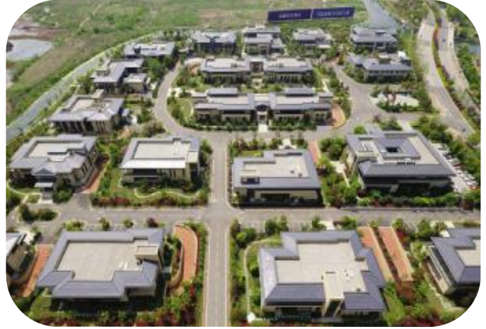
南湖区基金小镇一期

晶晖嘉宴中心由浙江嘉佳酒店有限公司投资建设，项目位于嘉兴市秦逸路西、塘泾路北，总建筑面积50550平方米，地下2层，地上宴会大厅3层，局部10层；宴会大厅由2个3000平方米超大无柱宴会厅和3个1000平方米无柱宴会厅组成，兼有2000平方米空中户外婚礼场地。项目于2018年2月8日开工奠基，2018年3月15日打桩施工，2019年1月19日顺利实现封顶，并于2019年4月27日正式试营业。嘉宴中心项目施工期间任务之重，时间之紧，工程量之大，开创了博元建设的先河，在全体参建人员的共同努力下，最终圆满完成项目的建设任务。