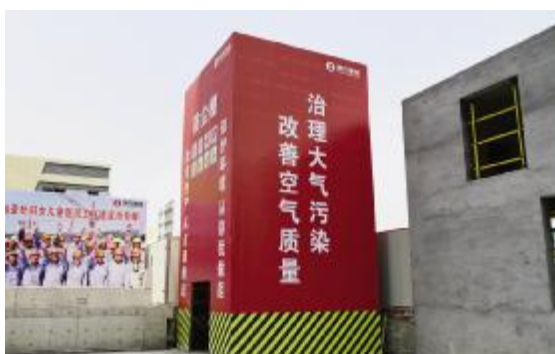
干混砂浆桶防尘棚