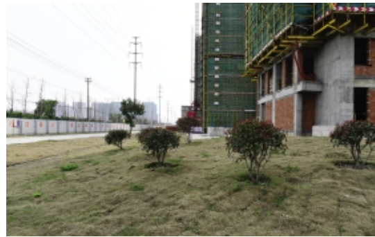
现场裸土部位种植绿化草坪