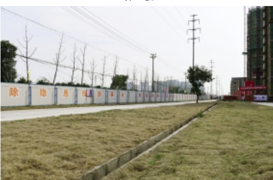
施工主干道和排水沟