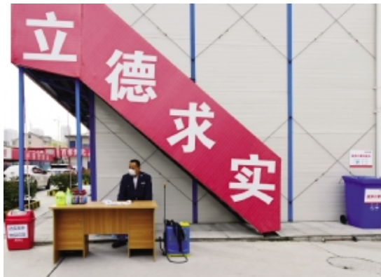
项目部准备充裕的防疫物资,落实专人负责防控工作

编者按:嘉善罗星街道红庙安置房小区项目,由嘉善县罗星街道新市镇投资开发有限公司投资建设,项目总建筑面积约为132148平方米,其中地上建筑面积约为94478平方米,地下建筑面积约为37670平方米,规划建设836套公寓式安置房,是嘉善县重要的民生工程。 自施工进场以来,项目部严格按照《安全文明标准化管理手册》组织生产,把文明施工渗透到现场各个角落。嘉善县有关方面领导、县人大代表和专家多次到工地实地考察,对项目的工程质量和现场文明施工举措给予了充分肯定。目前,项目已完成主体结顶,外墙装饰和二次结构施工正在进行中,预计今年年底可以交付使用。