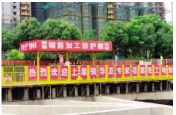
定型化钢筋加工防护棚