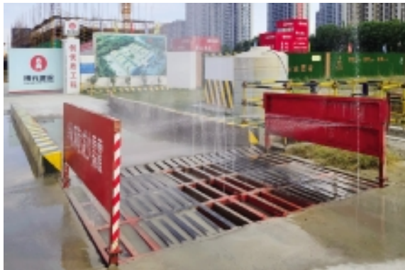
车辆冲水装置和泥浆沉淀池