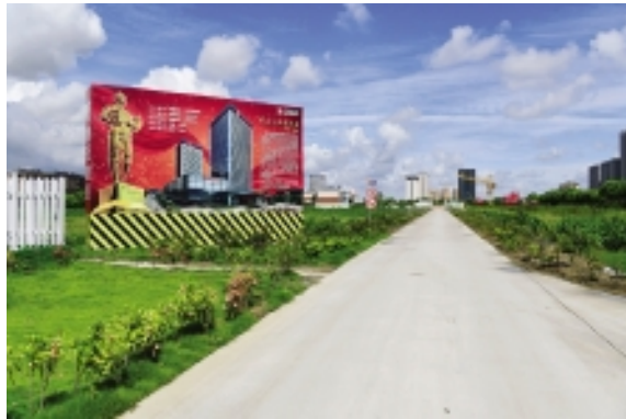
长达 300 余米的施工主干道