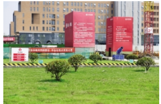
回填层绿化和干混砂浆桶防尘棚