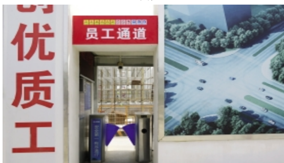
员工实名制管理通道