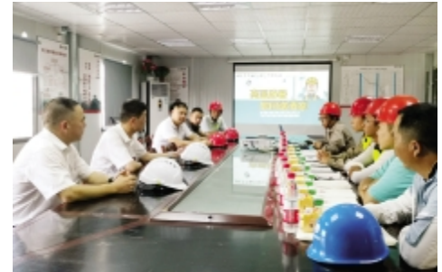
7月30日上午,海盐农商银行总部大楼项目建设单位领导到项目部慰问一线员工。(海盐农商银行项目部)