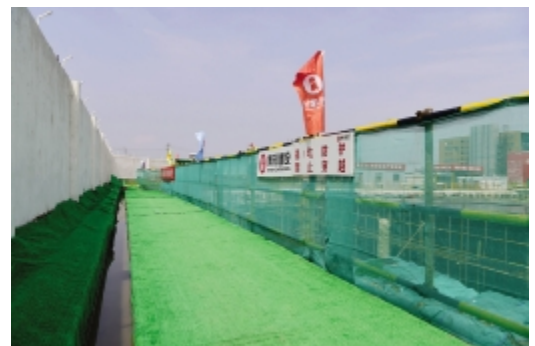
基坑临边防护和绿色通道