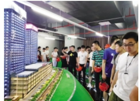
7月3日,同济大学浙江学院土木工程专业学生到我公司暑期社会实践。(技术中心)