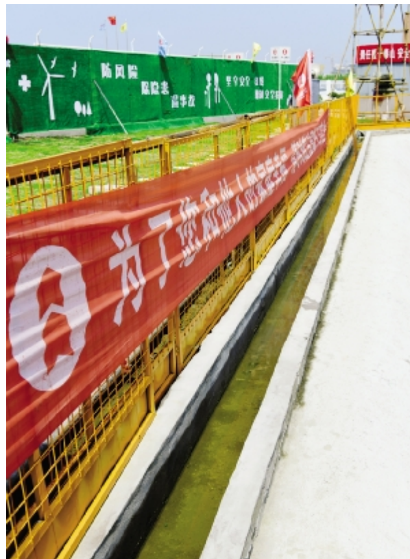
基坑排水沟和临边围护