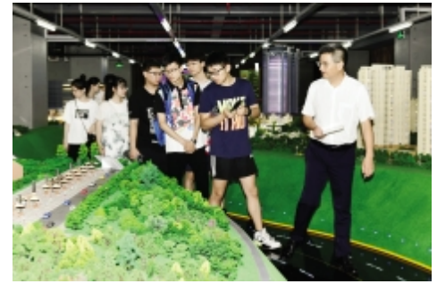
7月1日,嘉兴学院建筑工程学院学生到我公司暑期社会实践。图为参观我公司数字化展示中心。(技术中心)