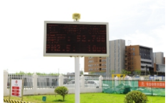
在线噪音扬尘检测