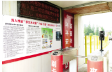
人脸识别实名制管理