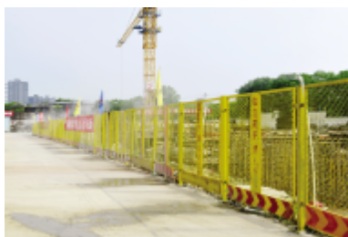
基坑围护有喷淋系统

编者按:南堰新景项目,位于嘉兴南湖东岸,由嘉兴城市建设投资有限公司投资建设,总建筑面积17167.3平方米,计划工期530日历天。走进施工大门,一条干净整洁的百米钢板道路直通项目部办公区,主干道旁的绿化带内植被茂盛,绿草茵茵,喷淋系统喷洒出细密的水珠,浇灌绿植,防尘降温;定型化制作的塔吊电缆线防护棚,设有喷淋系统的基坑围档,车辆停放整齐的停车场、环境优美的茶水亭、特色鲜明的现场围档……紧张忙碌井然有序是这个工地的常态。作为迎接建党百年嘉兴市区“十大标志工程”之一的南湖湖滨区域改造提升工程备受期待。据悉,湖滨区域改造提升工程项目总投资超过13亿元,建设工期为30个月,计划2020年建成开放。南堰新景、南湖里界、嘉翔印象、南湖书院等作为湖滨项目的组成部分,将进一步完善南湖景区的基础设施,使红色景区再升级,成为嘉兴旅游休闲新地标。