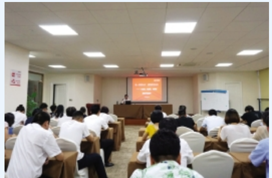
8月15日晚, 公司党支部组织开展“社情民意大走访、‘八八战略’大宣讲、思想观念大解放”内容宣讲活动。