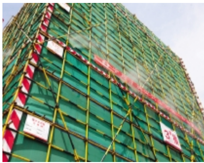
架体安装喷淋系统