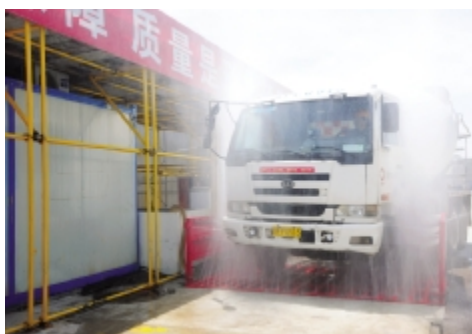
自动感应车辆冲洗