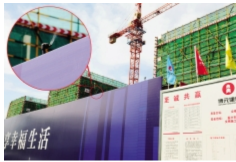
围墙上安装喷淋系统