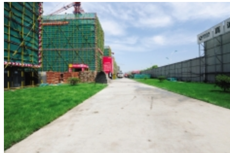
施工主干道和地表绿化