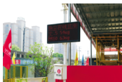
扬尘、噪音实时监测,环境保护到位