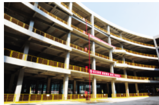
楼层定型化临边防护