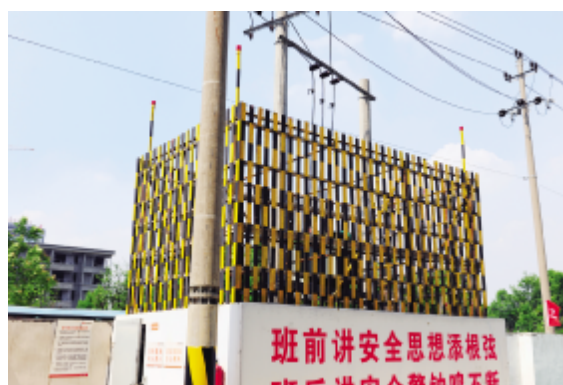
施工变压器防护棚,四角安装警示灯