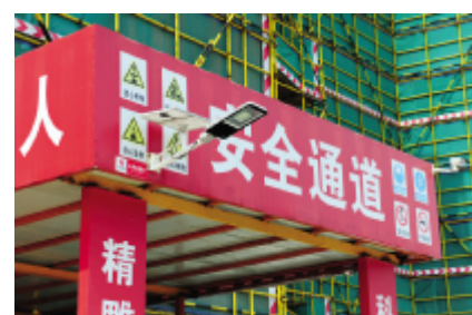
太阳能节能路灯和安全管理监控