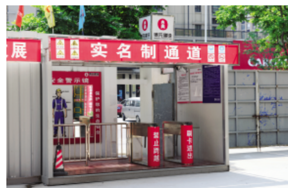
员工实名制管理通道