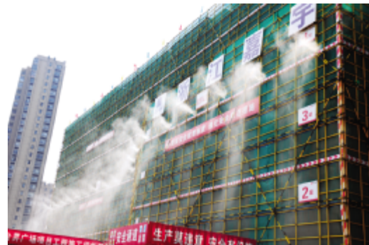
外架扬尘控制喷淋系统