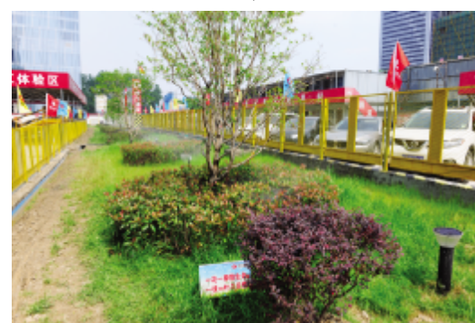
回填层种植绿化,安装喷淋系统,有效控制了扬尘