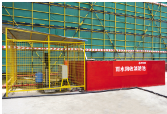
回收的雨水用作临时消防用水

台昇国际广场工程位于嘉兴国际商务区南湖大道与长水路交叉口,建筑高度100米,总建筑面积为226543.3平方米(地上面积为152675平方米,地下面积为73867.7平方米),其中人防总建筑面积为44050平方米,为浙江省目前最大的人防工程。 项目开工以来,项目部严格按照创建“浙江省建筑安全文明施工标准化工地”要求组织施工,全方位引入节能与环保产品,把绿色施工管理渗透到工程建设的每一个环节,取得了较好的经济效益和社会效益,受到了各方的好评。 (编辑部)