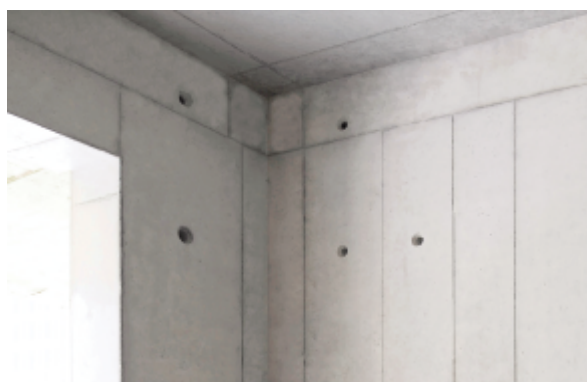
室内砼结构阴角方正