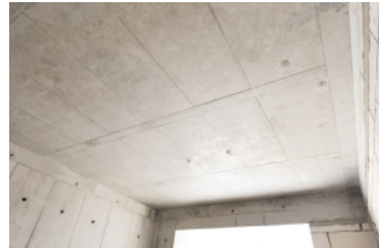
砼板底平整,接缝偏差小