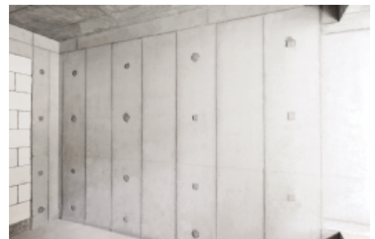
剪力墙垂直度偏差小,平整度高