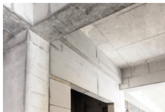
电梯前室过梁下挂