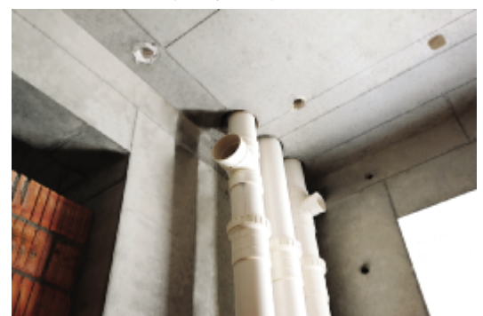
预留洞位置准确、排布整齐