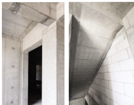
竖向构件棱角分明