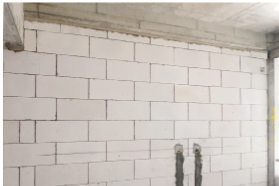
加气砌块顶塞规范