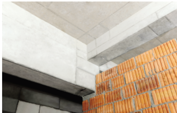
卫生间门过梁下挂