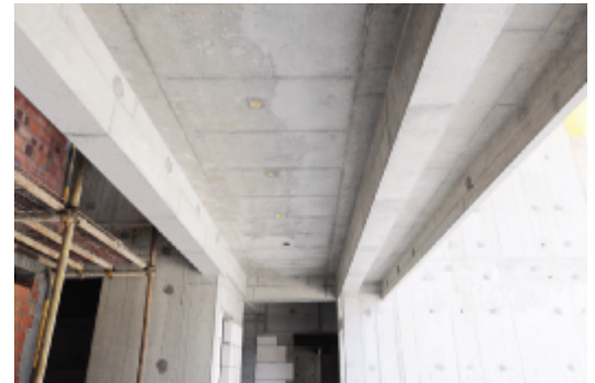
砼构件线角顺直,表面平整