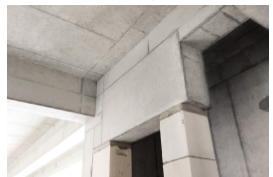
管道井门过梁下挂