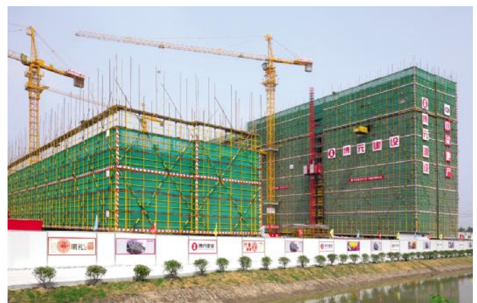
中梁秀湖壹号院工程施工现场

怎样能使工班管理由被动向主动转变?王迟中知道一切问题的根源在于“利”。尺有所短寸有所长,人们对利的取舍无非是取长远利益和眼前利益的区别。高明的管理是引领大家心往一处系,劲往一处使。要使“综合评估”真正有意义,只有靠优良的品质,做一项工程立一座“丰碑”,才能实现博元建设总裁寿财良提出的“让企业健康发展,让员工健康成长”的目标。在王迟中眼里,第三方“飞检”,无非是检验的手段,起决定作用的还是要引导团队“风物长宜放眼量”。但理性的管理者不能“口惠而实不至”。两者必须有机结合,有批评也有表扬,有处罚也有奖励,这样才能做到上情下达,令出如山。所以,在秀湖壹号院班组开展成果评比显得如火如荼。如砌筑阶段,按照总承包合同规定,项目的实测量成绩必须在85分以上。项目部就以85分为标准,对每幢楼每一层实测结果进行评比:多一分栋号长可以获得奖励200元,班组奖励1000元;少一分栋号长就要被罚款200元,班组罚款1000元,并且必须推倒重来。奖罚分明的效果立竿见影,施工现场成为竞技场,工班的积极性被完全调动了起来。(下转三版)