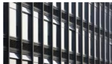
断桥隔热多腔金属型材玻璃窗