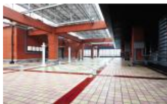
广场砖铺贴平整,美缝处理