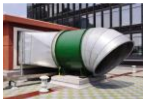
风机排风口采用虾皮帘和45度倾斜