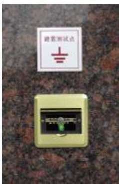
避雷测试点标识清晰