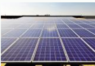
多晶硅光伏电池组安装平整