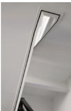
滴水线顺直,棱角分明