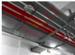
管道、桥架采用共用支架