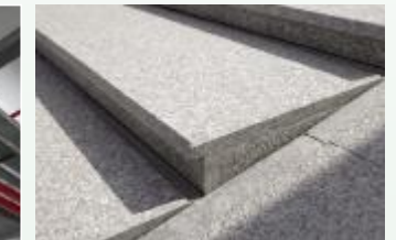
自行车道阴角排水沟