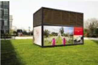
通风井与LED电子屏相得益彰