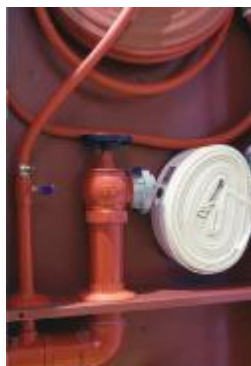
消防管道定制装饰圈