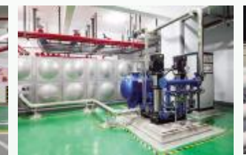
无负压变频供水机组