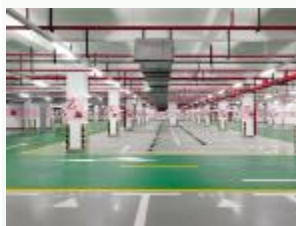
地下停车场管梯横杆垂直,标识清楚