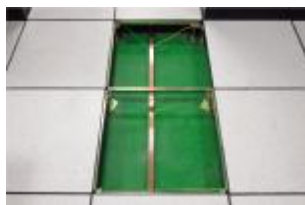
静电地板接地工艺精细