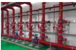
湿式报警系统标高一致